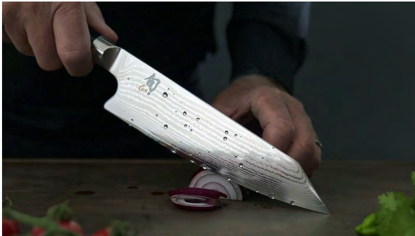
“Special Edition” Kiritsuke zum 20-jährigen Jubiläum, CHF 299.--

SPECIAL OFFER: Besuchende der Tage der offenen Tür profitieren von einem 20 % Rabatt und einem Gratis-Gravurservice – auch eine personalisierte Geschenkidee für sich oder andere.