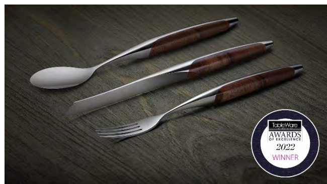
Das sknife Besteck gilt als schönstes Besteck