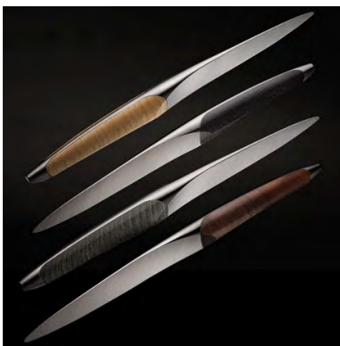
Griff-Varianten aus stabilisiertem Holz: Esche hell, schwarz eingefärbt und grau sowie Walnuss

Mit der Gründung der Schwesterfirma sknife im Jahr 2014 wurden bereits 2015 die ersten Steakmesser ausgeliefert. Seit 9 Jahren fertigt sknife an der Neuengasse in Biel Steak- und Taschenmesser. Die sknife Messer wurden mit 4 Internationalen Designpreisen ausgezeichnet und sind mittlerweile in den weltbesten Restaurants mit über 200 Michelin Sternen eingedeckt. Dank dem neuartigem Chirurgenstahl sind die Messer auf Yachten und in Restaurants am Meer bestens etabliert – und in den besten Hotels an der Côte d'Azur hat sich sknife gar profiliert.