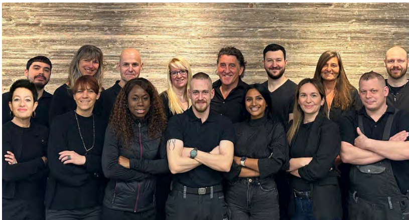
Aus 2 mach 16: Persönliche Beratung dank kompetentem und stetig erweitertem Team

Kunden und Partner schätzen die familiäre Atmosphäre, das Engagement und die partnerschaftliche Zusammenarbeit. Messerkompetenz aus 20 Jahren Erfahrung fliesst jeden Tag dank den geschulten und engagierten 16 Mitarbeitern in die Beratung ein.